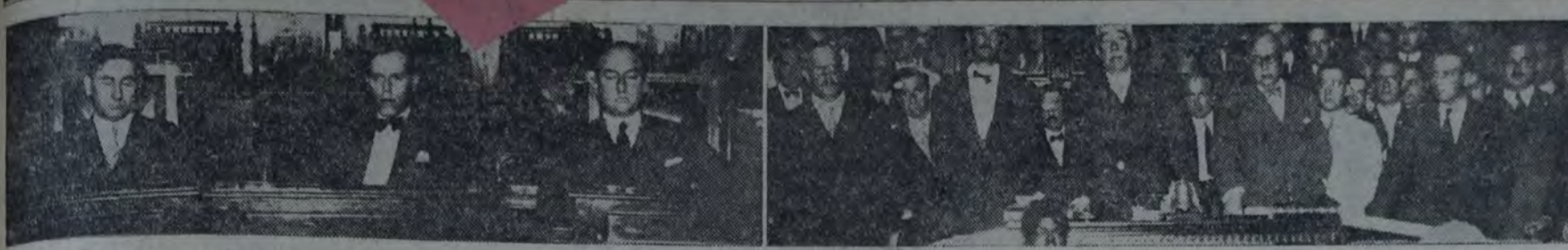
EN LA TARDE DE AYER, A LAS 17 HORAS, LA JUNTA ELECTORAL PROCEDIÓ A EFECTUAR, SEGUN ESTABA ANUNCIADO, LA PROCLAMACION DE LOS CONCEJALES electos el 2 de diciembre corriente. El acto se realizó en el recinto del concejo deliberante, y luego de dar la información pública de los resultados del escrutinio y de la adjudicación de bancas a cada partido, se procedió a la lectura de los nombres de los electos, haciéndose entrega de inmediato a cada uno, de los respectivos diplomas. En la primera de nuestras notas gráficas aparecen tres de nuestros concejales en sus bancas y en la segunda el intendente municipal y en la tercera el momento de la proclamación.